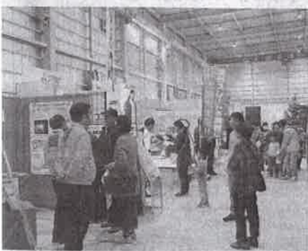
の披露と併せて取扱商材を周知